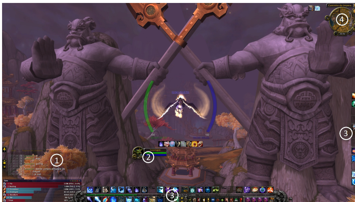
Figura 5 – Interface gráfica padrão do jogo World of Warcraft

possibilidade das pessoas aprenderem a liderar, depende muito mais do jogador saber extrair o que é importante para, então, poder aplicar isso no seu lado profissional.