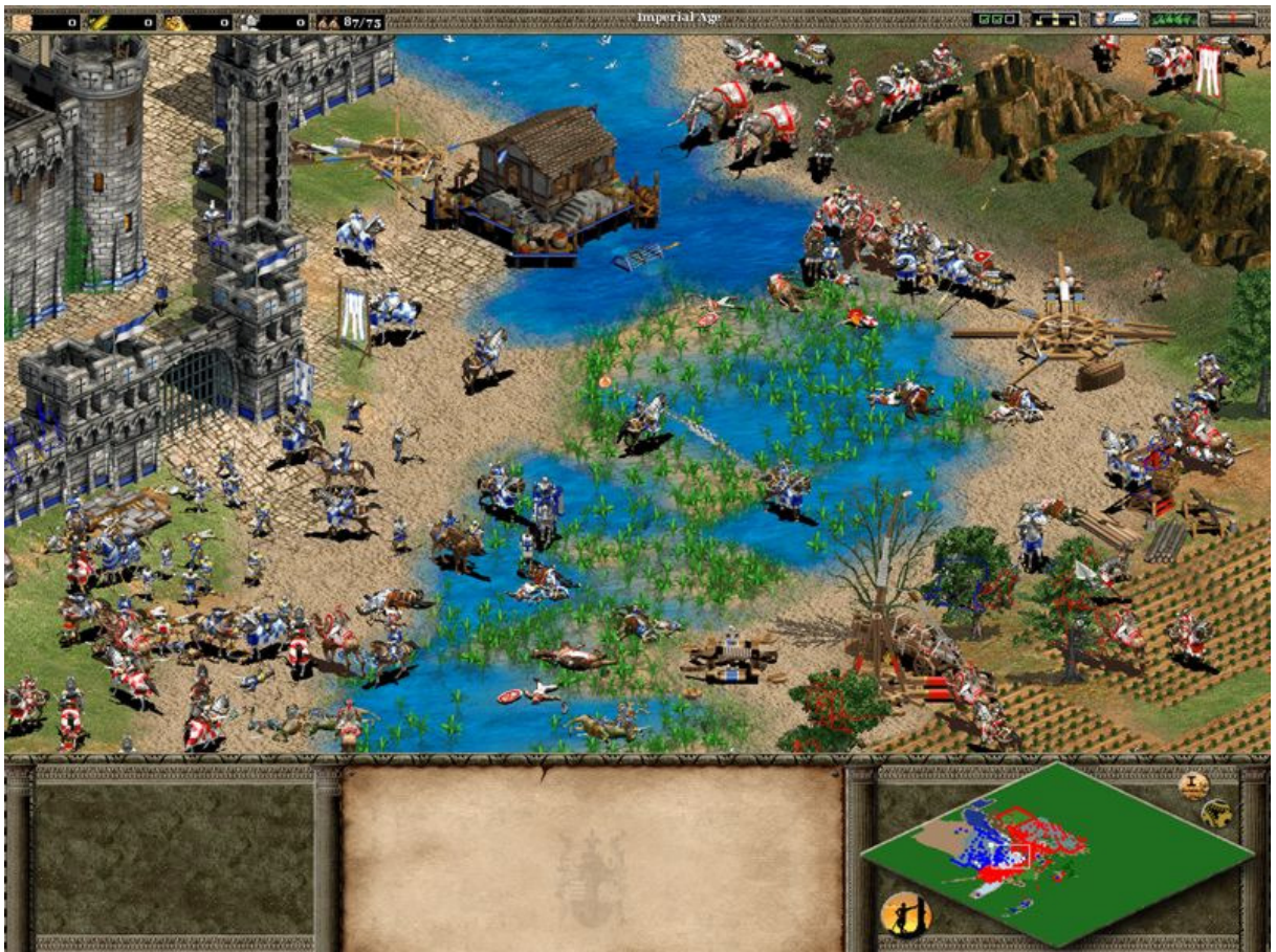
Figura 9 – Age of Empires II: Campo de batalha

Normalmente, o campo de batalha de Age of Empires possui unidades diversificadas, porém seguem um padrão: