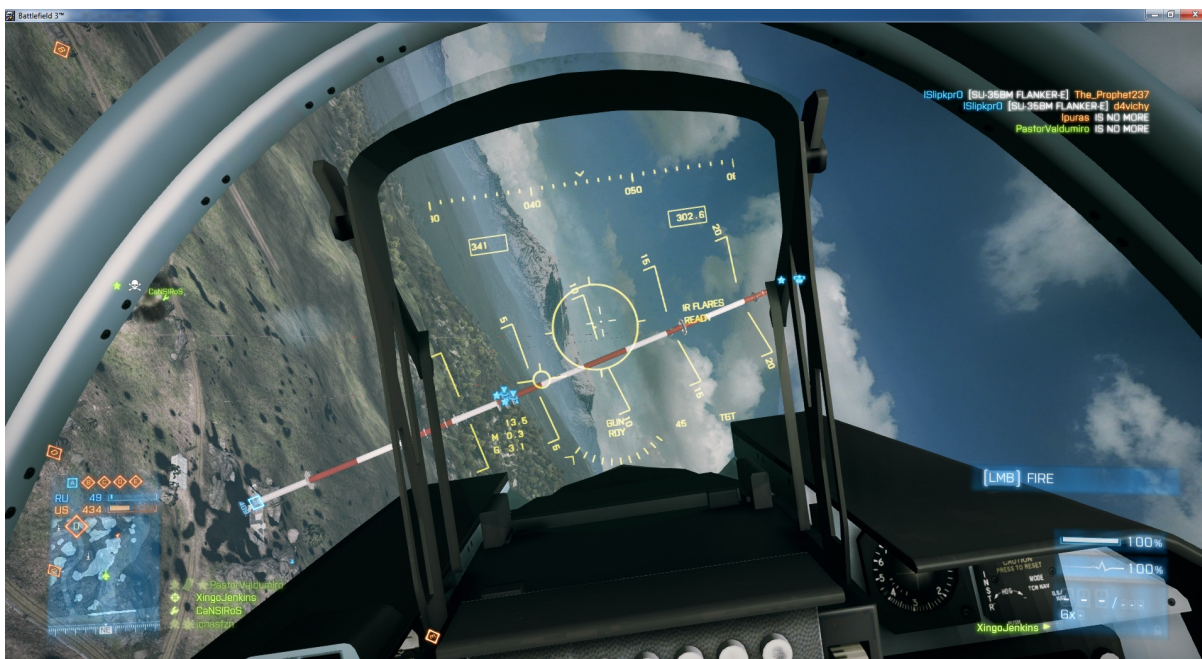
Figura 4 – Interface do jogador ao pilotar um caça

O cockpit tenta retratar a realidade de um avião de caça, simulando a mira, altura, orientação do caça com relação ao chão, altitude e velocidade. Além disso, também é aplicada a gravidade e a física em todos os objetos, tanto nos caças quanto nas balas disparadas pelas armas. Por exemplo: uma bala disparada pelo atirador de elite em um alvo a 300 metros de distância perde velocidade e realiza uma trajetória no formato de parábola, pois a gravidade age na bala conforme ela viaja em sua trajetória. Isso é uma prova de que os jogos atuais estão beirando a realidade, podendo, desta forma, ser utilizados em treinamentos de pilotos, por exemplo, para aperfeiçoar suas habilidades dentro do campo de batalha.