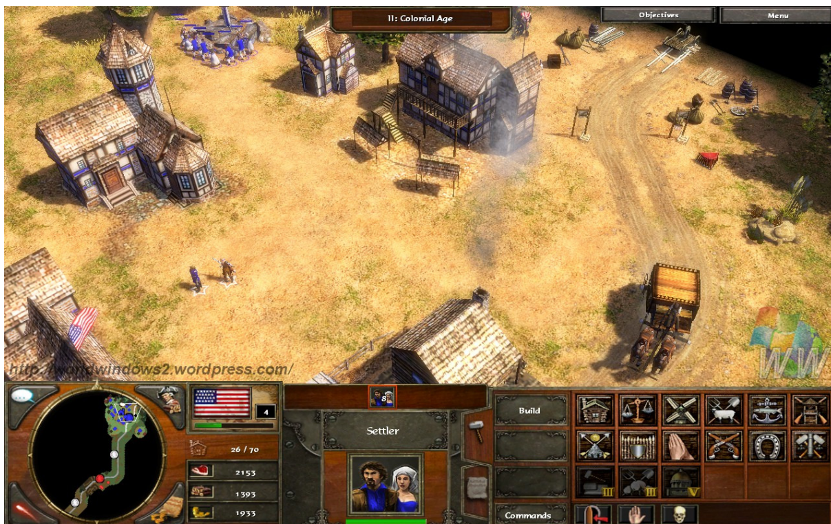
Figura 10 – Age of Empires III: Administração de recursos e estratégia de evolução

Sendo assim, se o jogador souber extrair este detalhe, aprenderá a fazer a gestão não só do jogo, mas a gestão no lado pessoal e também do lado profissional, pois conseguir pensar na melhor estratégia utilizando os recursos disponíveis para a resolução de um problema da empresa é um diferencial bastante importante.