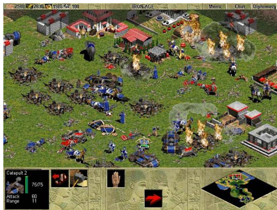
Figura 5 – Age of Empires 1. Pioneiro dos jogos RTS

colônias e metrópoles. Personagens históricos aparecem em todos os jogos da série, desde Alexandre, o Grande a Napoleão Bonaparte.