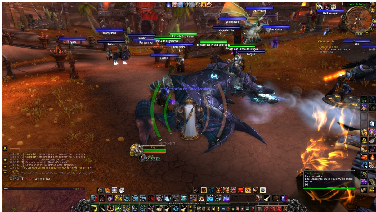
Figura 1 – World of Warcraft: Jogadores em uma das cidades principais do jogo.

Atualmente, o World of Warcraft está em sua quarta expansão, aumentando para 90 o nível máximo que pode ser alcançado. Os jogadores podem ficar mais fortes, porém terão que enfrentar monstros mais fortes e mais desafiadores do que os anteriores.