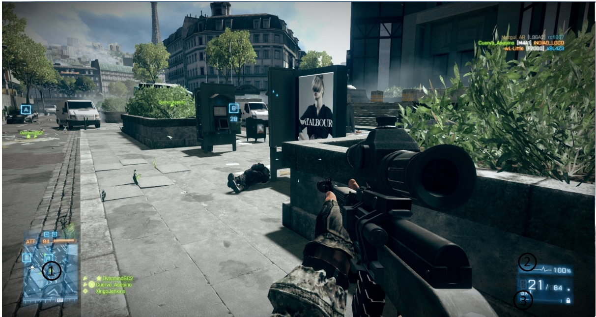
Figura 3 – Interface do jogador inicial, ao começar o jogo

Como é possível notar na imagem acima, o personagem possui pouca interface gráfica quando está a pé. Esta interface possui a localização do jogador (1), seus sinais vitais (2) e sua munição atual/total (3). Entretanto, esta interface pode ficar mais complexa quando o jogador entrar em um caça (ver figura 4), por exemplo, onde existem muito mais comandos, uma vez que se tenta chegar o mais próximo possível da realidade de se pilotar um avião de caça. Como exemplo de comandos e de aumento de complexidade dos mesmos, temos: