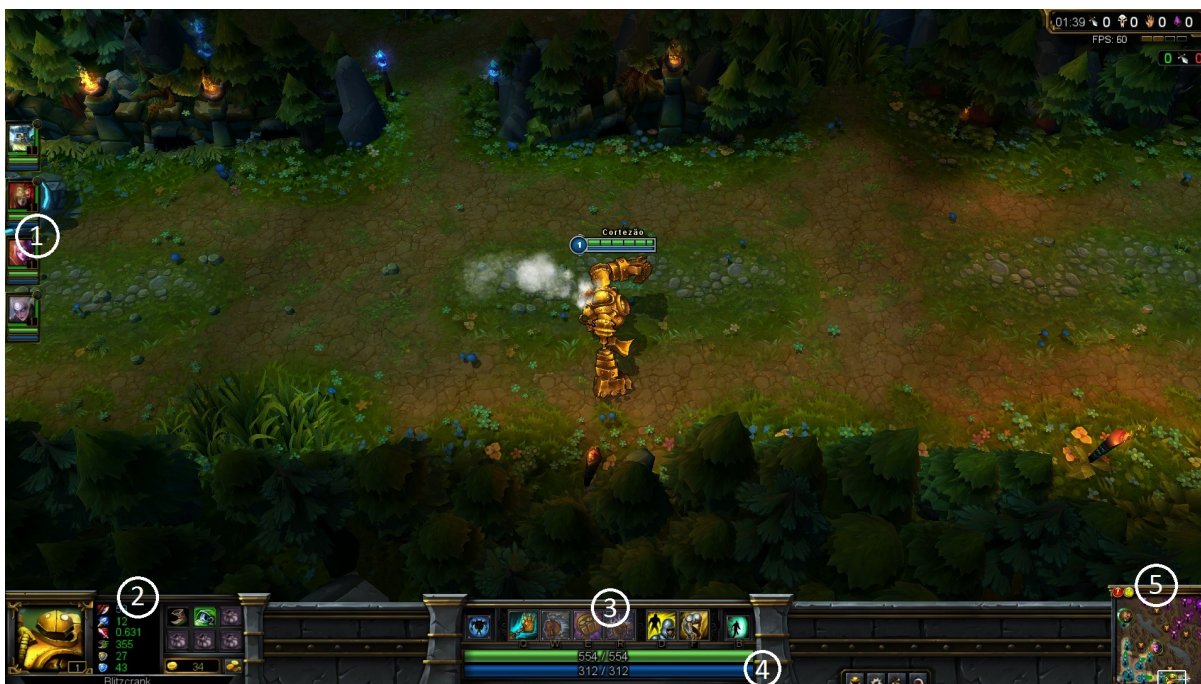
Figura 2 – League of Legends. Interface do jogador

A imagem acima mostra como é a interface de cada jogador. O jogador tem informações básicas do time (1), status do seu herói (2), habilidades do seu herói (3), seu HP (Health Points) e MP (Mana Points) (4) e um mapa de toda a arena (5).